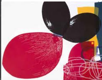
Air Flower, 76x56 silkscreen